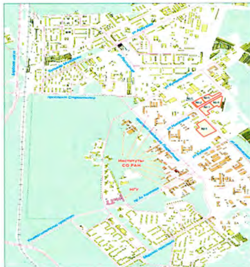
Рис. 2. Схема расположения земельных участков Академпарка

аренде – 4,1 га. Схема расположения земельных участков Академпарка в Советском районе г. Новосибирска приведена на Рисунке 2.