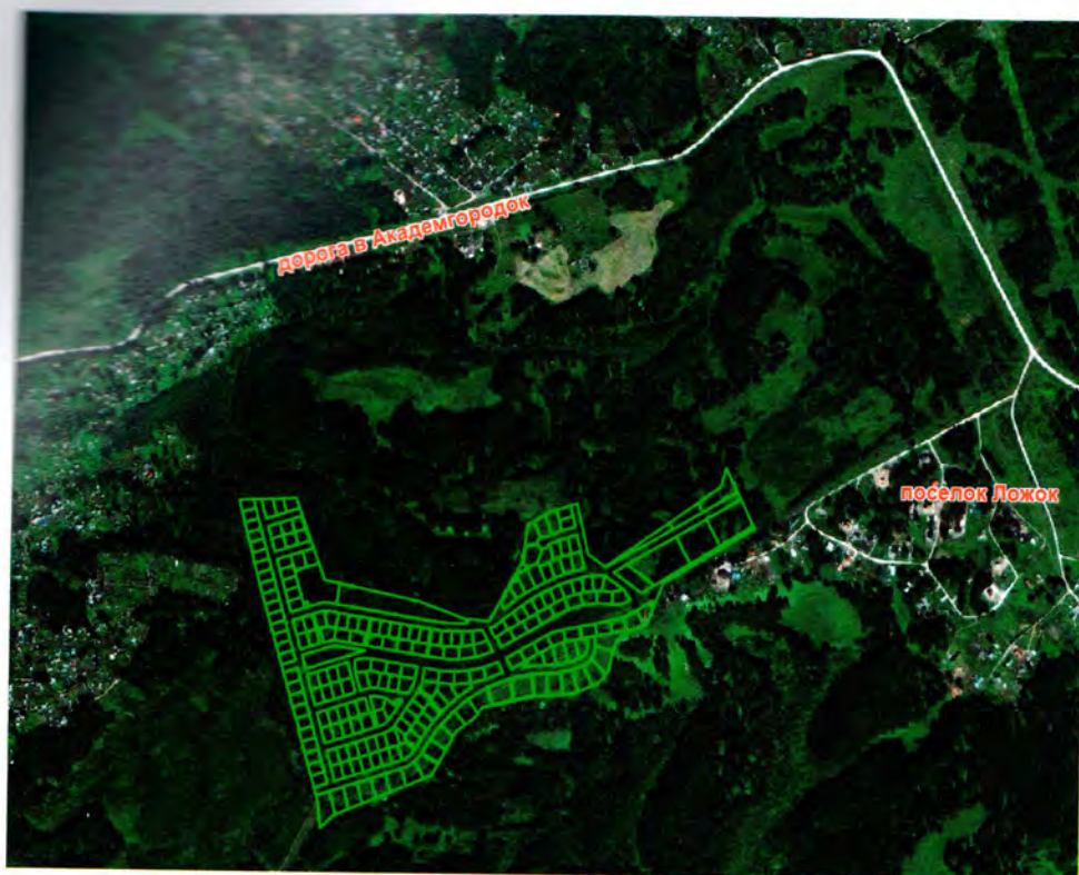
Рис. 4. Схема расположения земельных участков Академпарка для целей жилищного строительства в п. Горки Академгородка.

В 2017 году Общество продолжало реализацию программы по строительству коттеджного поселка «Горки Академпарка» в поселке Ложок Барышевского сельсовета Новосибирской области в рамках реализации жилищной программы Академпарка. Строительство ведется в соответствии с Федеральным законом № 214-ФЗ от 30.12.2004. Всего за 2017 год заключено 20 договоров долевого участия на общую сумму 107 252 тыс. рублей. Изменено условий, в связи с внесением изменений в проекты, по 7 договорам долевого участия увеличена цена на 15 906 тыс. рублей, по 3 договорам уменьшена цена на 3 846 тыс. рублей. Расторгнуто 8 договоров долевого участия на общую сумму 80 734 тыс. рублей. По состоянию на 31.12.2017 заключено и не исполнено (ведется строительство) – 53 договоров долевого участия на общую сумму 462 208 тыс. рублей.